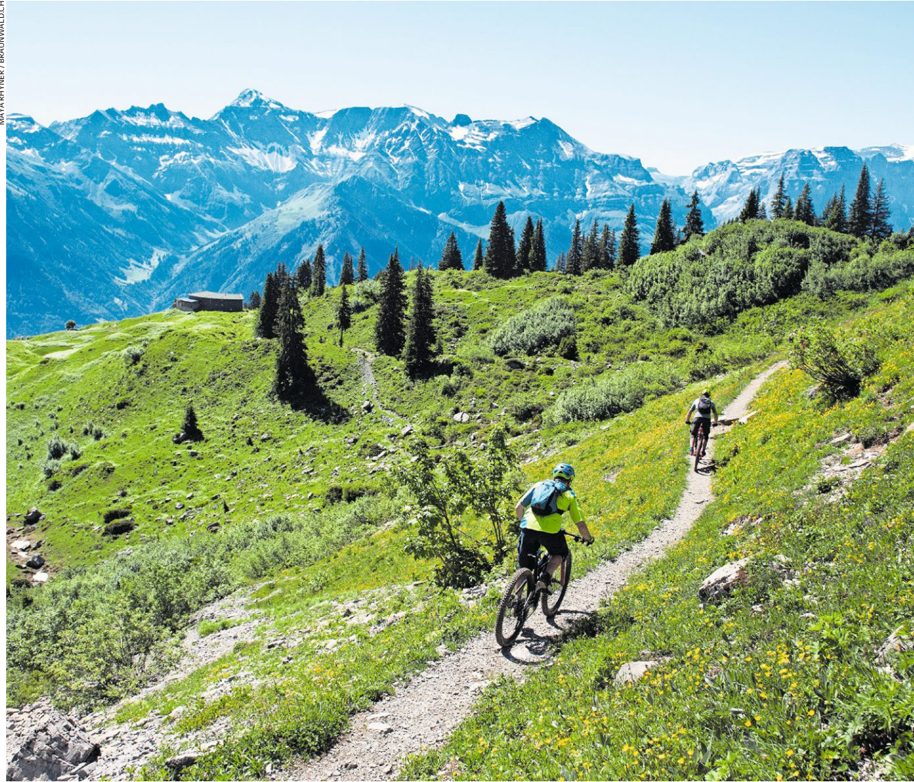
Anfahrt auf die Braunwaldalp: Für einen Zwischenhalt und eine Stärkung eignet sich das Ortstockhaus (Mitte links).

Route: Schwanden - Thon - Leuggelen - Bächialp - Braunwald - Ortstockhaus - Braunwald - Reha-Clinic - Linthal - Schwanden Strecke: 34,3 km / 1400 hm Schwierigkeit: mittel Eine der schönsten Touren im Glarnerland, das viele wegen seiner Steilheit meiden, führt von Schwanden zum Ortstockhaus auf der Braunwaldalp. Die anderthalb Stunden Aufstieg auf der Forststrasse via Leuggelen zur Bächialp sind der anstrengendste Teil der Tour. Gut, dass man sich bei knapp der Hälfte der Fahrzeit in der Alpwirtschaft mit hausgemachtem Käse oder Quark stärken kann. Danach geht es auf einem schönen Singletrail, der kürzlich planiert und damit fahrbar gemacht wurde, nach Braunwald hinüber. Ein knapp einstündiger Singletrailspass mit Traumblick zum Tödi. Ab Braunwald führt ein Forstweg, der gegen Ende zeigt, was das Glarnerland an Steilheit zu bieten hat, hinauf zum Ortstockhaus auf der Braunwaldalp. Auf