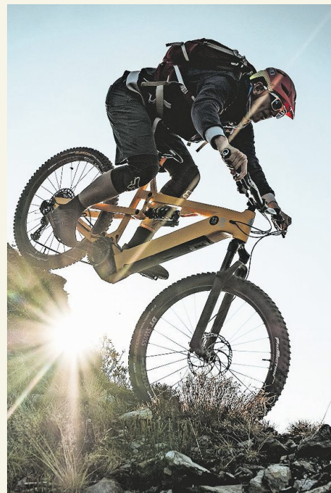
Besonders heikel: Bremsmanöver.

Geplänkel. Am Rand des Hochplateaus wird die Strasse zum Singletrail und taucht in die Tiefe ab. Im Zickzack und mit ein paar Schiebepassagen führt dieser hinunter ins mystische Safiental, ein typisches Walsertal. Gegen den Hunger hilft ein Teller Capuns oder Tatsch im Restaurant Rathaus in Safien Platz, einem 500-jährigen ehemaligen Rathaus. Oder man pedaliert weiter, durch lichte Wälder zum Talkessel, und stärkt sich im Berggasthaus Turrahus in Thalkirch, einem 300-jährigen Walserhaus auf der Gartenterrasse. Hier hat die Beschaulichkeit ein Ende, und es geht via Tomülpass ins Valsertal. Nur wenige schaffen den steilen Anstieg ohne Schieben. Der obere Teil dieser Etappe verläuft auf dem um 1940 von polnischen Interntierten erbauten Polenweg. Auf dem blumenreichen Tomülpass mit Blick auf Piz Tomül, Rheinwaldhorn und Piz Tambo sind die Strapazen schnell vergessen. Ein verspielter Singletrail führt über Alpwiesen hinab nach Vals, wo es sich in einer Beiz am Dorfplatz oder in der beliebten Therme des Architekten Peter Zumthor wunderbar von der Anstrengung erholen lässt.