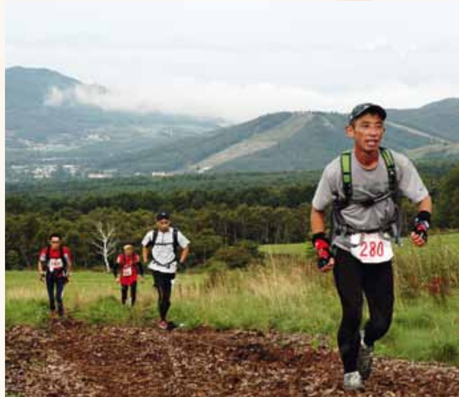
Für Europäer ist der Sugadaira Skyline Run recht schwierig zu laufen: Oft führt der Traillauf über schwierigen Untergrund mit losem Bambusgehölz.